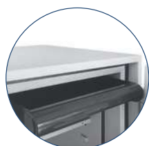
Ausziehbarer Fachboden (T)

Außentiefe ohne Beschläge und Schloss. Außenhöhe ohne Räder angegeben. Durch die Räder erhöht sich das Außenmaß in der Höhe um 20 mm.