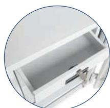
Ausziehbare Schublade (D)