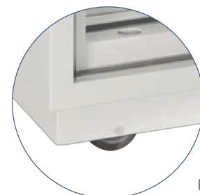
Rollen als Zusatzoption erhältlich