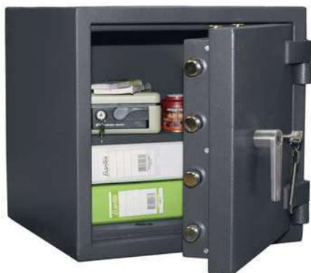
BASTION M 46