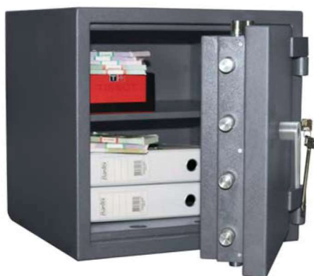
FORT M 50