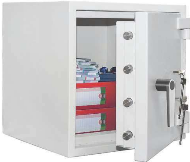
Valberg Banker M 55